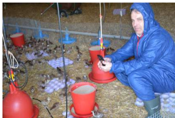
Les dindonneaux arrivés la veille, à un jour, ont déjà eu le droit à leur petite vidéo.

Il est même allé plus loin en participant à un colloque sur la communication instantanée. « L'intervenant nous a expliqué l'importance des liens entre Facebook et la partie paiement de nos sites Internet, pour que le client ait le moins de manipulations à faire.