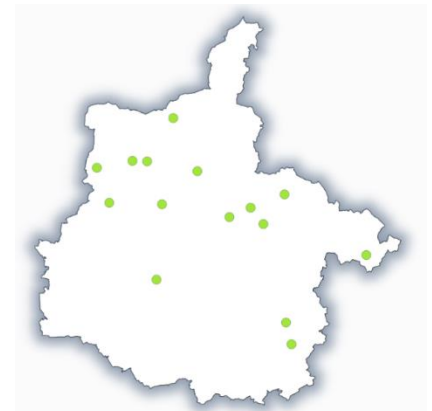
Hauteurs d'herbe (en cm) par site

De belles croissances sont attendues la semaine à venir.