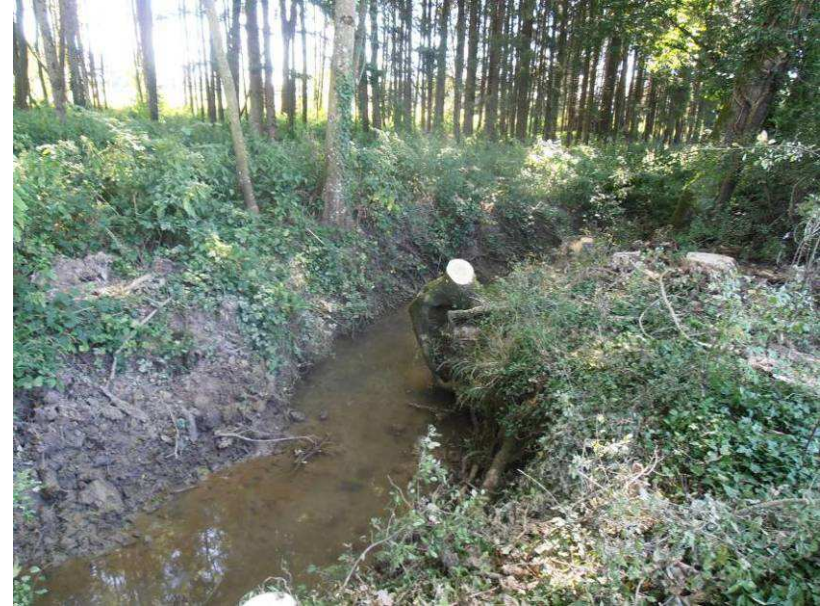
Après : Coupe de la végétation et restauration de l'écoulement des eaux