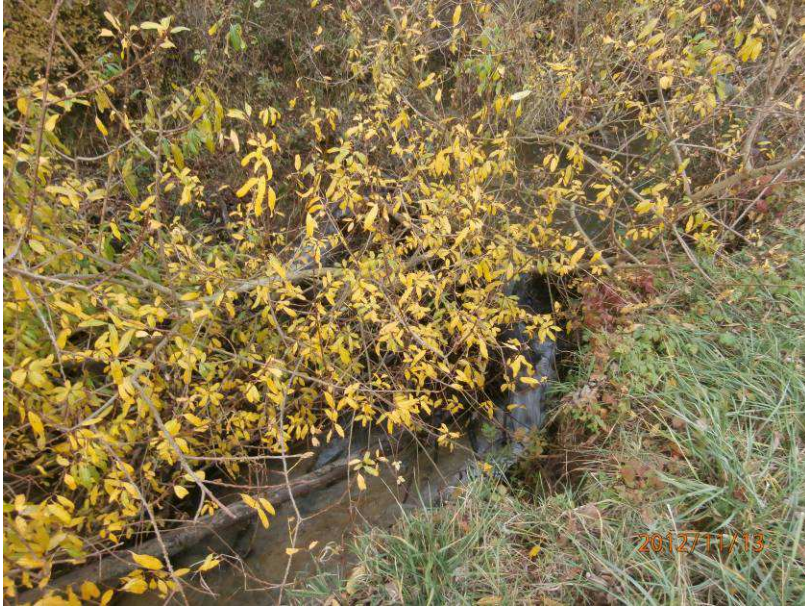
Avant : Végétation buissonnante fortement développée sur le lit du ruisseau créant un frein au transit des branchages en surface du ruisseau => encombre