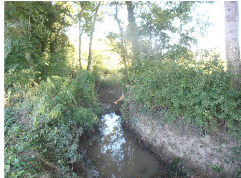
Après : Extraction des encombres du ruisseau