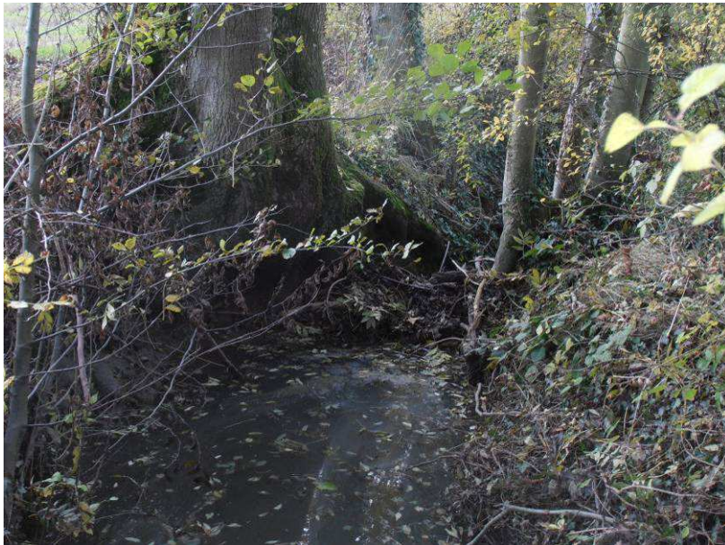
Avant : Nombreux encombres créant des retenues tout au long du parcours du ruisseau sur la partie amont