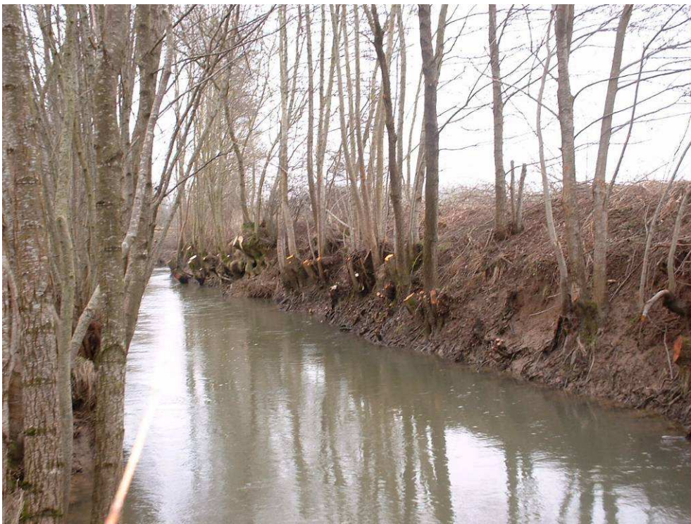
Réalisation de la coupe sélective