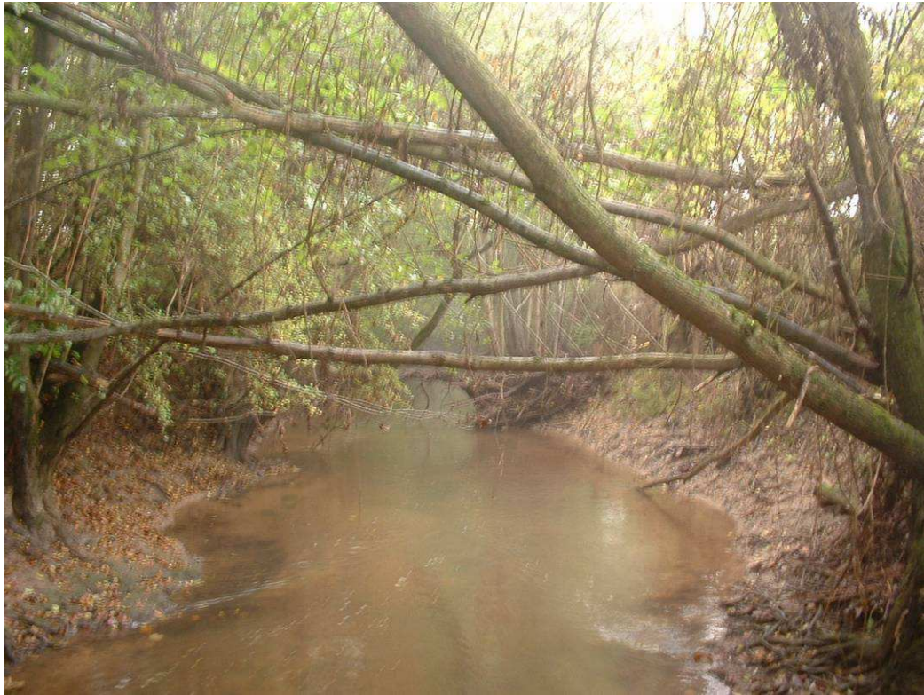
Exemple de cépée de saule vieillissante à reprendre avant éclatement