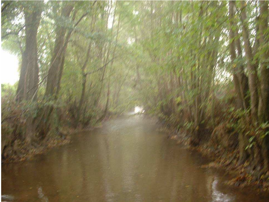
Aval moulin de Sery : ripisylve équilibrée mais de classe d'âge homogène