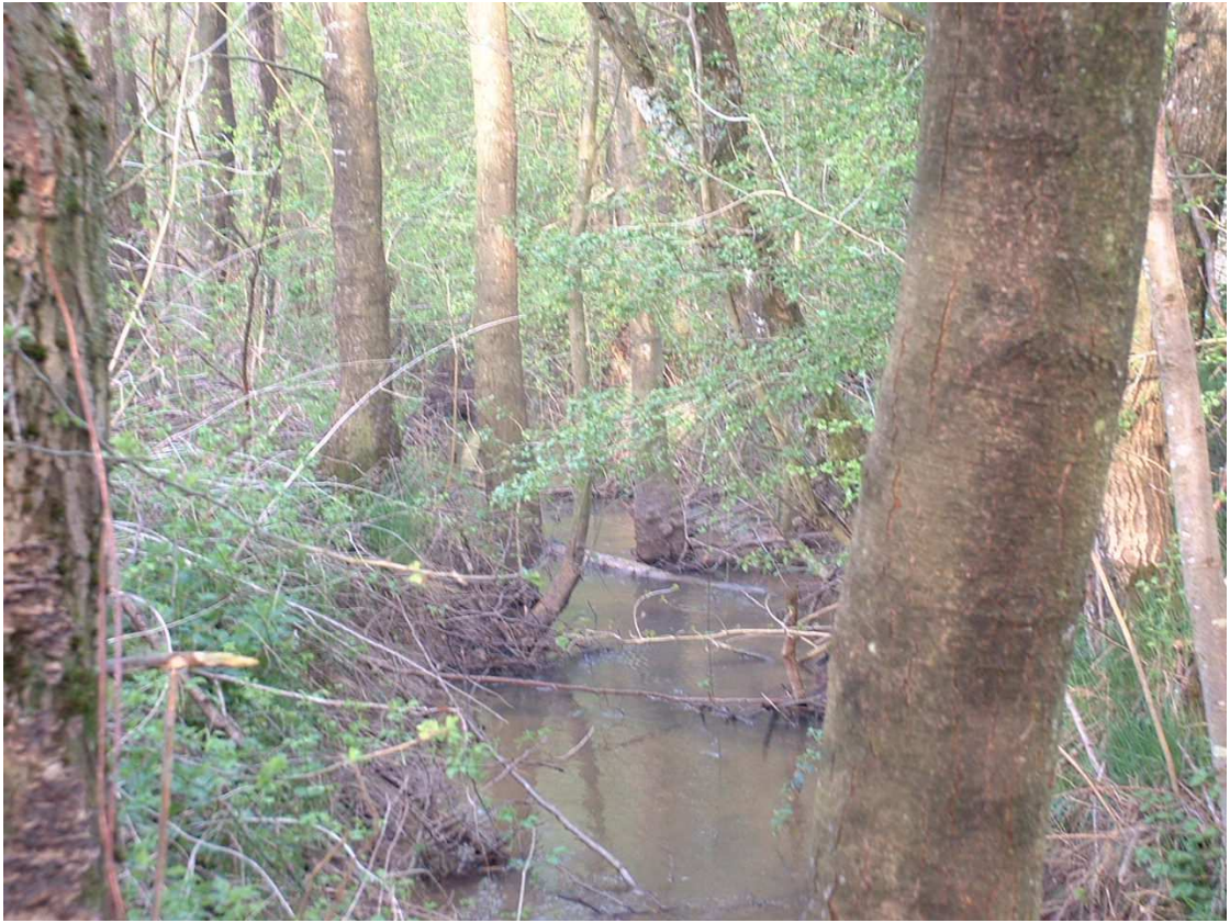
Sélection à faire sur la ripisylve existante