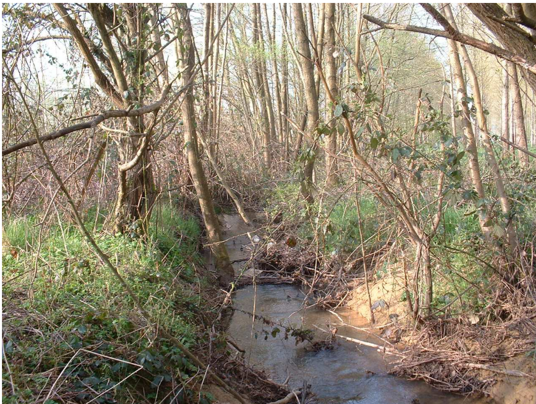
Tronçon encombré en aval de l'aqueduc de la SNCF