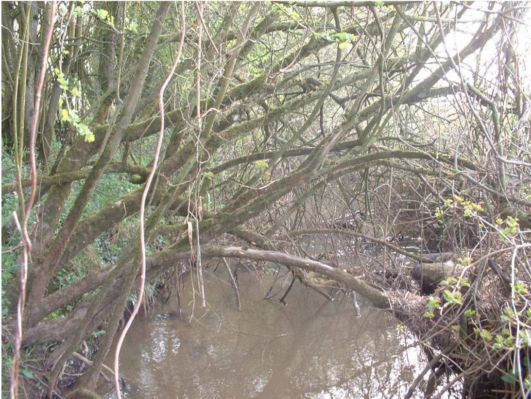
Ruisseau encombré par végétation mortes ou vivantes