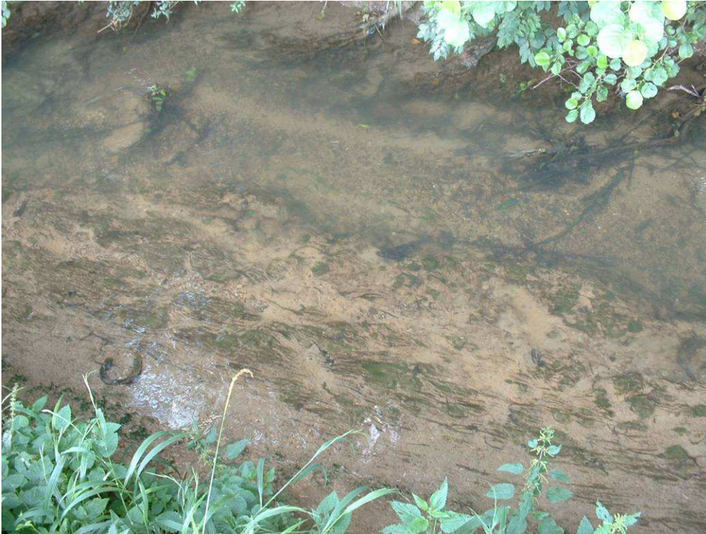
Commune de Faux Aval pont SNCF plus de substrat : Bed Rock