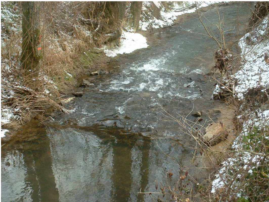
Réalisation d'un radier sur ce tronçon décapé