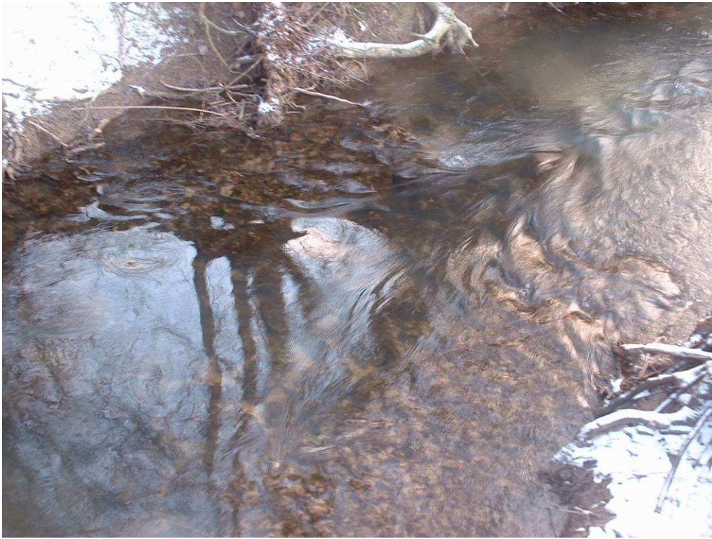
Exemple de déflecteurs avec apport de graviers