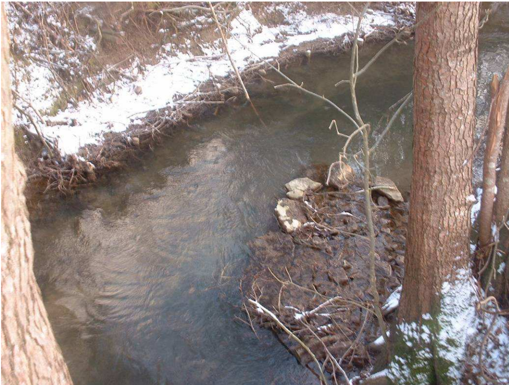
Exemple de déflecteur en rive droite et création d'un peigne avec sous berge en face