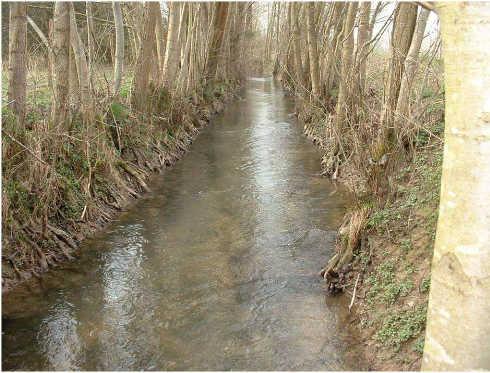
Limite commune Faux Sorcy : Zone rectifiée, substrat partiellement absent et écoulement homogène