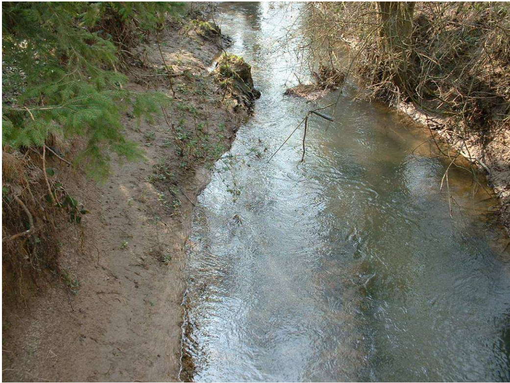
Commune de SORCY : Bed rock visible, substrat totalement décapé