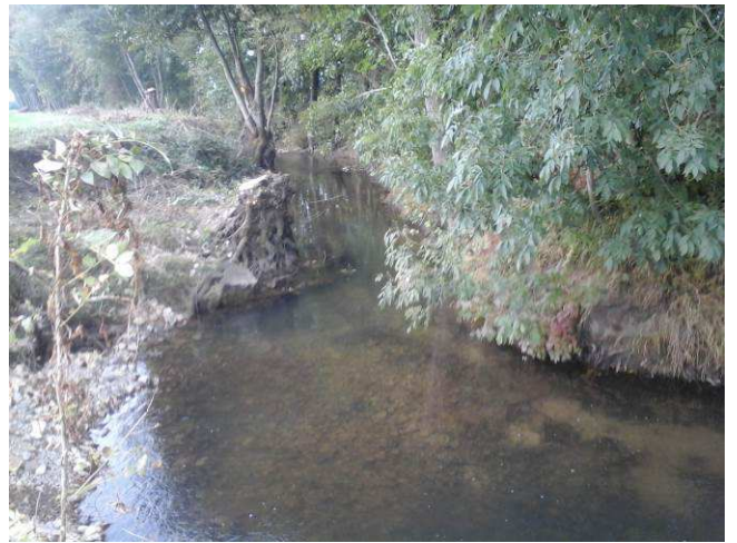
Point 17 Cépée d'aulne pied de berge : coupe et recharge du lit mineur zone 8