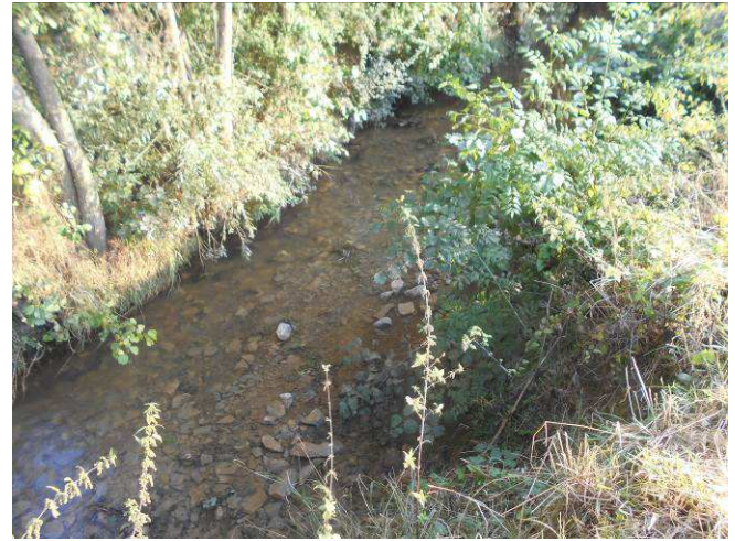
Point 26 du descriptif, gestion de l'Embâcle et recharge du lit mineur