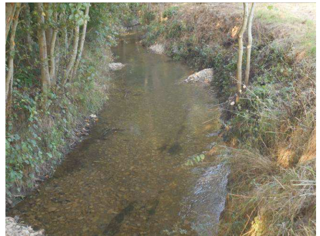
Tronçon AB aménagement zone 8 couche de gravier très fine et limite Bed Rock : apport de recharge 6-150