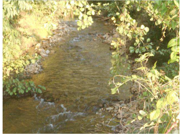
Zone 1 lame d'eau homogène, recharge pour recréer dépôt gravier : idem à photo