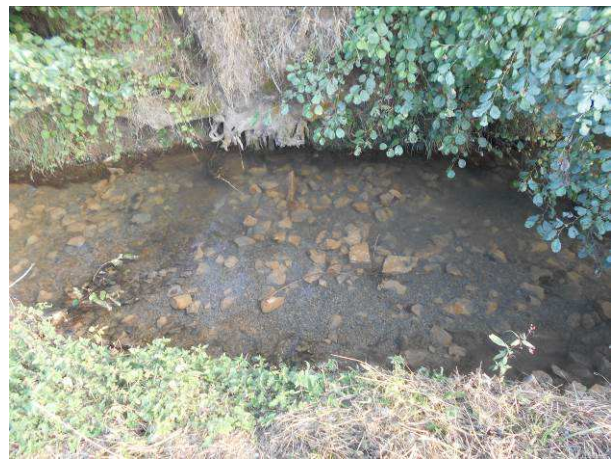
Secteur Chenalisé zone 2 du descriptif avant et après recharge