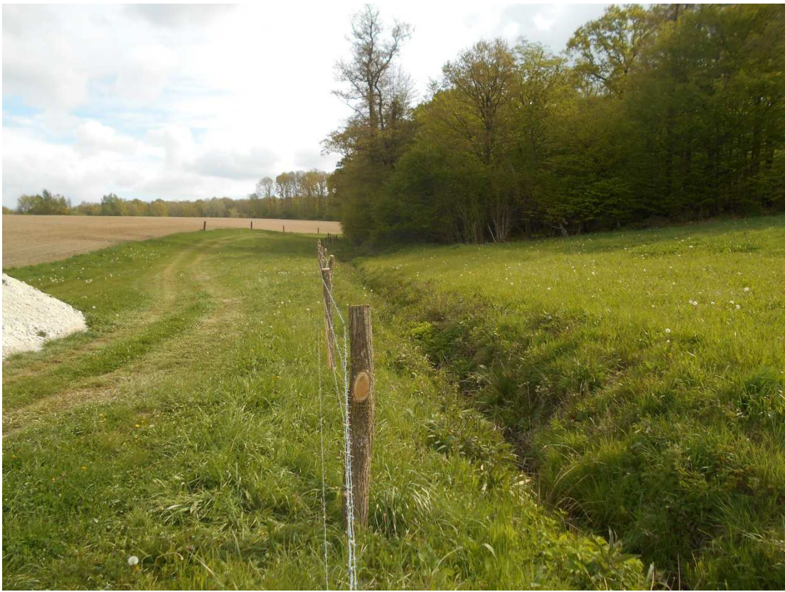
Installation Clôture sur un affluent de la Saulces restauré en 2015 : La Fourcière