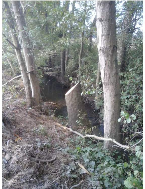
Coupe pour futur Têtard