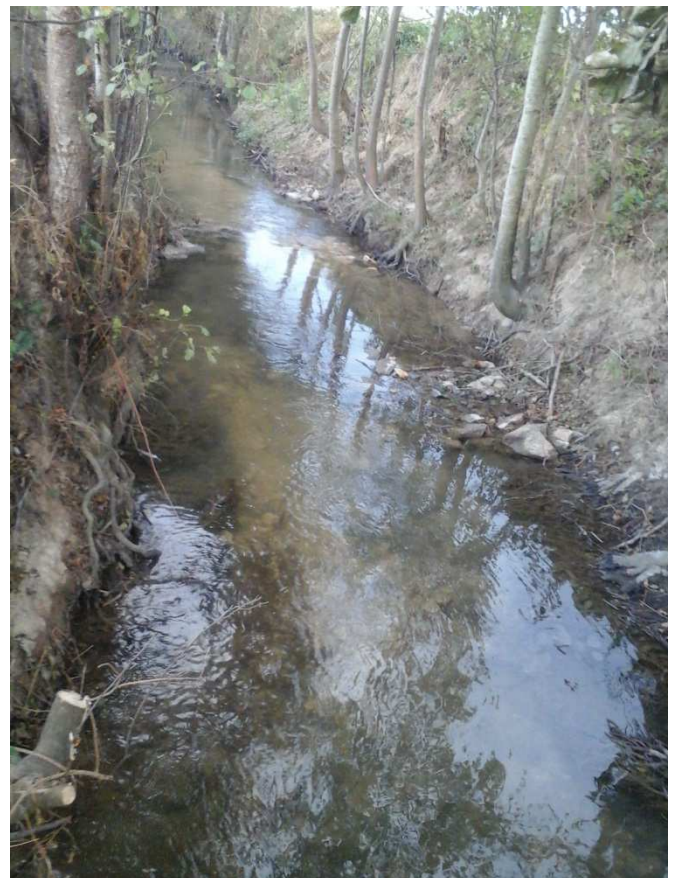
Coupe sélective et recharge du chenal