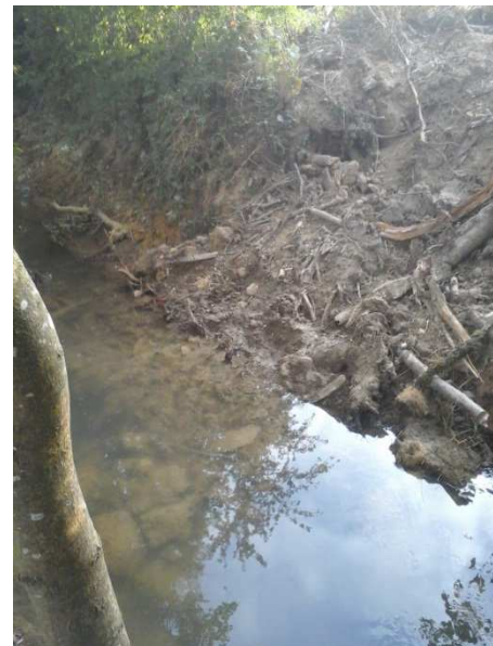
Extraction de la souche car retombée dans le lit après coupe de la grume