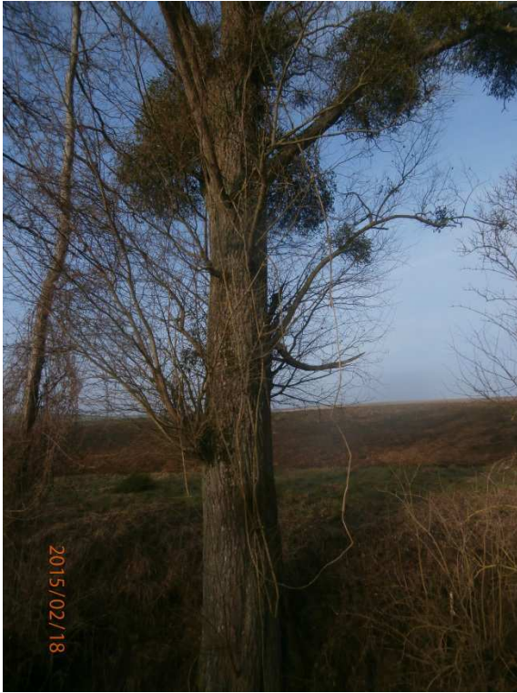
Saule à mettre en têtard