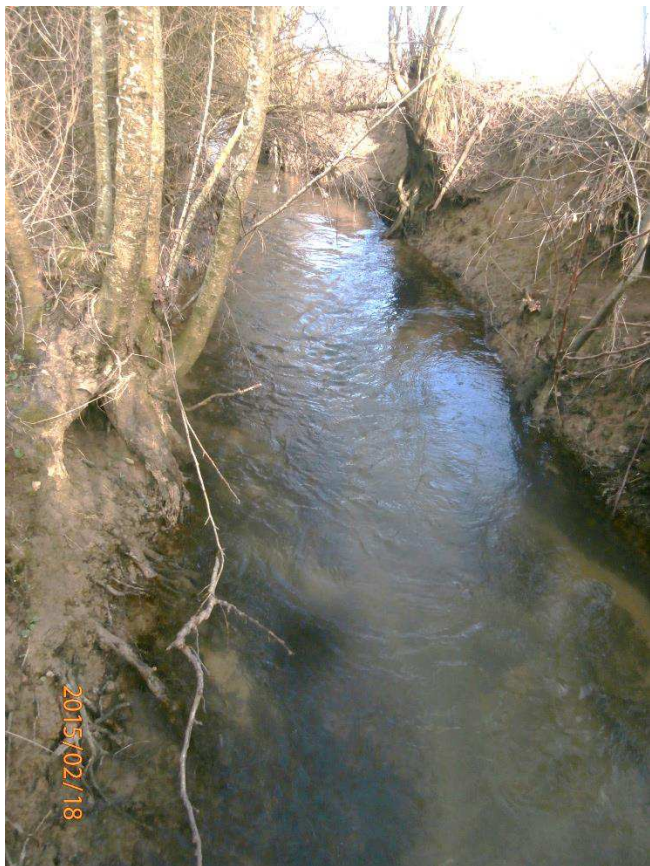
Zone chenalisée à recharger