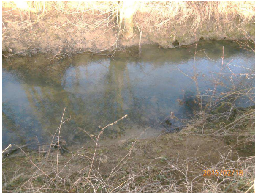
Secteur 545 m : chenal décapé malgré radiers faits en 2007 ci-dessous. La recharge s'est faite juste en amont