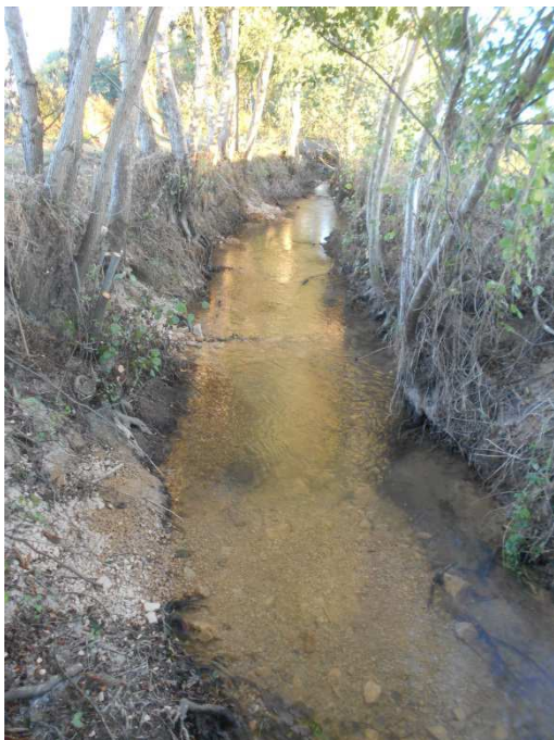
Coupe sélective et Apport de matériaux entre les radiers de 2007