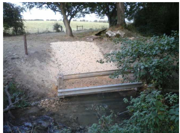
Réalisation d'une descente aménagée avec la Participation de l'exploitant qui a fourni les lisses et poteaux