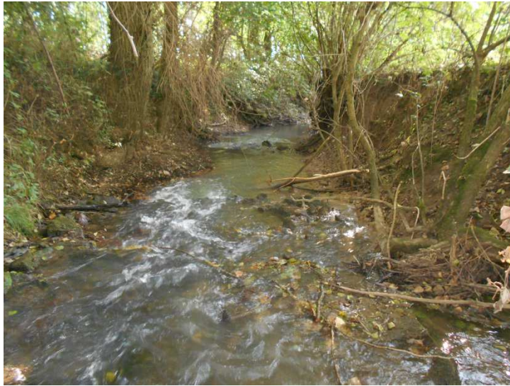
Radier existant point 15 à allonger