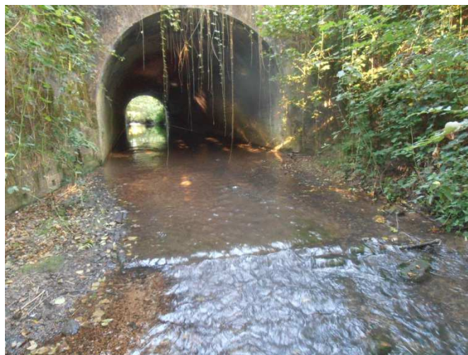
Point 1 : radier du pont chemin de fer : réalisation radier afin d'augmenter lame d'eau sous ouvrage