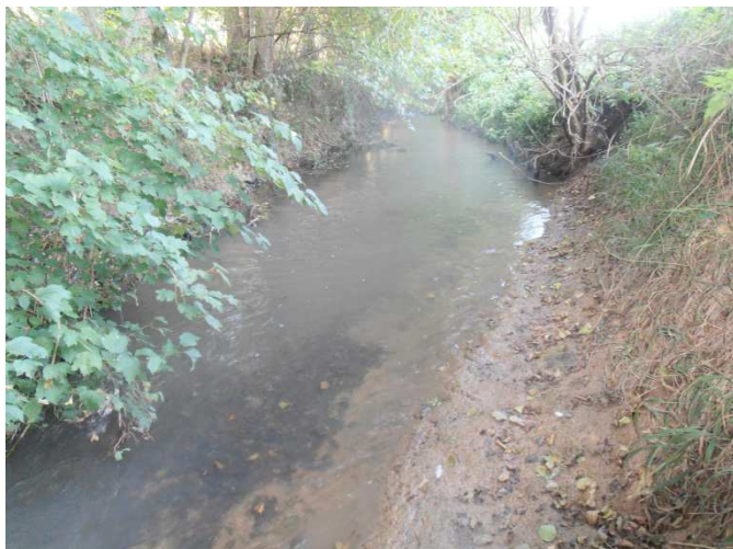
Zone 4 et 12 exemple de secteur déficit granulométrique