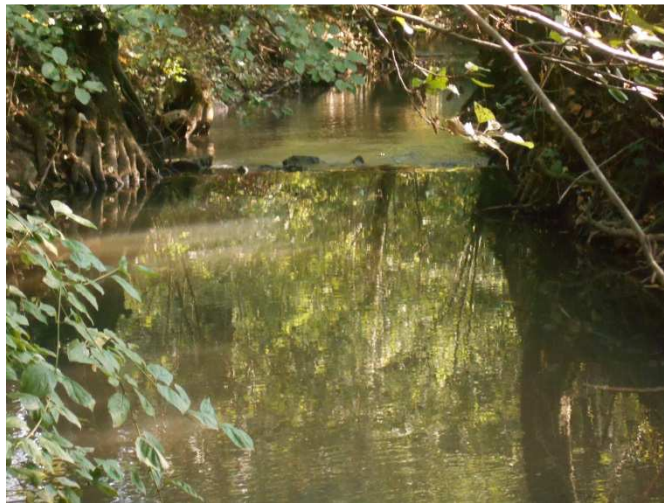
Zone 14 Exemple de radiers callés trop haut et déficit graveleux en amont et aval