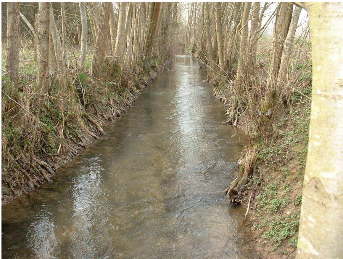
Peuplement homogène d'aulne à sélectionner pour différencier les classes d'ages