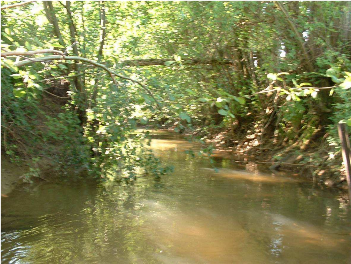
Rive droite couper à blanc par riverain en 2000 et rive gauche zone forestière : le milieu et très refermé