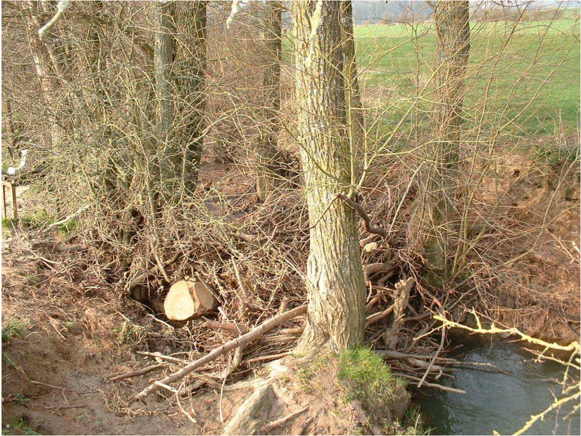
Exemple d'embâcle ponctuel