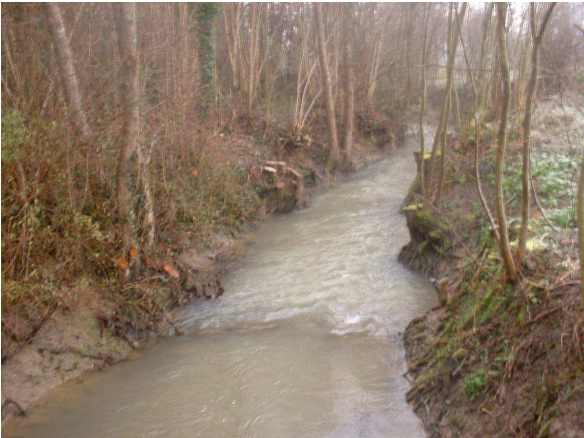
Après coupe sélective : les classes d'âges seront plus diversifiées et nouvel équilibre entre les ripisylves de chaque berge