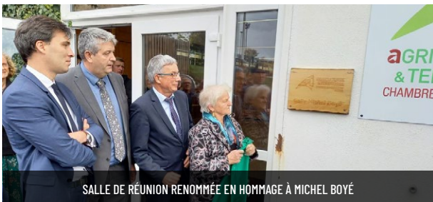
SALLE DE RÉUNION RENOMMÉE EN HOMMAGE À MICHEL BOYÉ