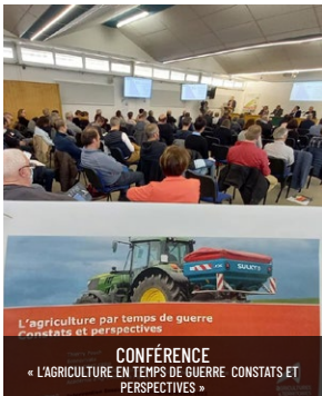
CONFÉRENCE « L'AGRICULTURE EN TEMPS DE GUERRE CONSTATS ET PERSPECTIVES »