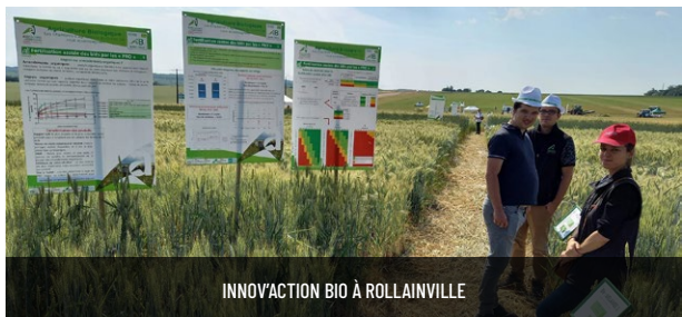
INNOV'ACTION BIO À ROLLAINVILLE