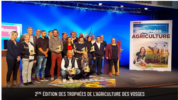
2 ÈME ÉDITION DES TROPHÉES DE L'AGRICULTURE DES VOSGES