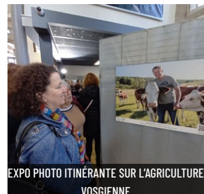
EXPO PHOTO ITINÉRANTE SUR L'AGRICULTURE VOSGIENNE