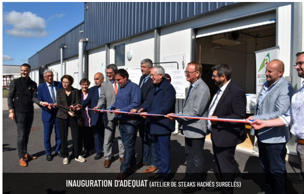
INAUGURATION D'ADEQUAT (ATELIER DE STEAKS HACHÉS SURGELÉS)